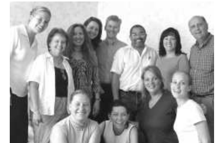
Teilnehmer der Gebetskonferenz

Jetzt liegt unsere Gebetskonferenz schon eine gewisse Zeit hinter uns, dennoch möchten wir euch ein wenig davon berichten. Obwohl wir dieses Mal nicht so viele Teilnehmer hatten wie letztes Jahr, können wir doch sagen, dass es eine gesegnete Konferenz war. Die Teilnehmer kamen jeden Morgen zusammen, um von verschiedenen Pastoren und Leitern über die Missionsarbeit in Frankreich zu hören, danach wurde für die Situation und die Arbeit im Allgemeinen gebetet. Nach dem Mittagessen machte sich die Gruppe auf, um unsere verschiedenen Arbeiten vor Ort zu besuchen. So bekamen sie konkrete Informationen über den gegenwärtigen Stand der Gemeinde oder Pionierarbeit. Hier wurden die Möglichkeiten und Probleme der einzelnen Arbeiten diskutiert und dann gezielt dafür gebetet. Durch diese Gebetskonferenz bekamen die Teilnehmer einen guten Überblick über die Mission in Frankreich und über unsere