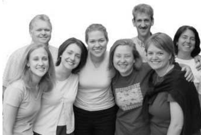
Vorn links unsere 4 Praktikantinnen

Sie mußten auch eine Woche eine Sprachschule besuchen (auch gerade die Streikwoche) und haben gemerkt, dass es viel Geduld und Aushaltvermögen braucht, bis sie sich in einer anderen Sprache ausdrücken können. Die beiden amerikanischen Mädchen werden diese Woche abreisen, und wir haben deswegen mit allen Vieren eine Auswertung der vergangenen Praktikumszeit gemacht. Sie stimmten überein, dass es keine leichte Zeit war, aber dass die Schwierigkeiten dazu dienten, dass Gott ihnen Mängel und Sünde zeigte und dass sie sich auf Gott und seine Vergebung verlassen müssen, um als Team zusammenzuarbeiten. Sie haben gelernt, auf den anderen zuzugehen und auch die (kulturelle) Andersartigkeit zu akzeptieren. Es