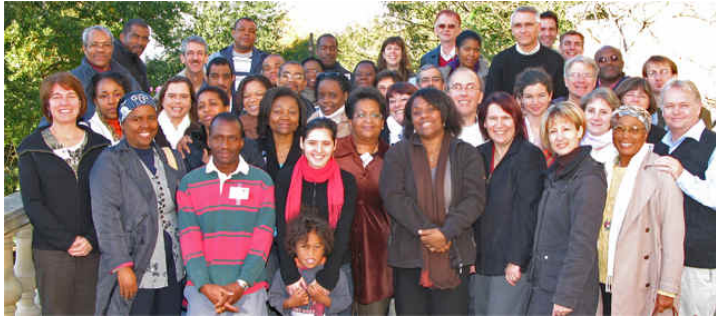
Teilnehmer der Mitarbeitertagung

Anfang September hatten wir ja zu unserer 25-Jahr-Feier in unsere Heimatgemeinde in Müden eingeladen. Wir hatten ein sehr schönes Wochenende, an dem wir viele Freunde begrüßen konnten, die unseren Dienst schon sehr lange begleiten. Für uns selbst war dieses Wochenende auch ein besonderer Meilenstein, an dem wir Gottes Treue und Fürsorge über die letzten 25 Jahre feiern konnten. Allen, die gekommen waren oder die Grüße gesandt haben, möchten wir noch einmal ganz herzlich danken.