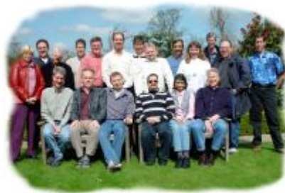
Treffen der Europaleiter

Meine Aufgabe ist nun, die Gesamtarbeit der Mission zu koordinieren, Mitarbeiter zu betreuen, Kontakt zur amerikanischen Mission zu halten. Außerdem hat mich unser europäischer Direktor in sein Leitungsteam berufen, so dass ich auch auf Europaebene mitwirke. So war ich in den letzten Wochen häufig unterwegs. Zunächst bat mich unsere amerikanische Mission zu einer Klausurtagung über die zukünftige Struktur unserer Mission nach USA zu kommen, um durch meinen Beitrag als Nichtamerikaner vielleicht einen anderen Blickwinkel in die Diskussionen zu bringen. Danach ging es nach Italien, um an der Jahreskonferenz für die euro-