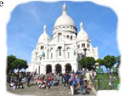
Frankreich braucht evangelikale Gemeinden

Gerade wegen der Säkularisierung sollten wir über Mission in Europa wieder ganz neu nachdenken. Während es in Korea ca. 15% evangelikale Christen gibt (in China 6%, in Kenia 35%, in Brasilien 12%, in Deutschland 2,9% - Quelle: Johnstone; Gebet für die Welt.), gibt es