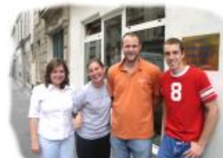
Unsere Praktikanten 2005

päischen Feldleiter teilzunehmen. Weiterhin gehört es zu meinen Aufgaben, unsere Mission hier in Frankreich innerhalb des evangelikalen Raums zu vertreten. Zwar bin ich aus dem Komitee für die RIME-Konferenz (Konferenz für Gemeindegründung) ausgeschieden, treffe mich aber regelmäßig mit französischen Pastoren und Mitarbeitern in den verschiedenen Komitees zur Zusammenarbeit. Das alles ist manchmal nicht leicht, unter einen Hut zu bekommen. Dennoch ist es für unsere Gemeindegründungsarbeiten sehr wichtig und trägt zum Wachstum der Gemeinden in Frankreich bei. Danke, wenn ihr auch für diese Dienste beten würdet.